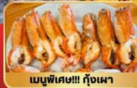
เมนูพิเศษ!!! กุ้งเผา